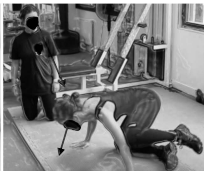
Bild 2. Övningen utförs.

Räkneordfraserna i vårt material har en uppmuntrande och motiverande funktion, genom att de hjälper motionärerna att hålla reda på var de befinner sig i övningen och därmed ge dem möjlighet att kanalisera sina krafter därefter. Detta gäller även de räkneordsfraser som uttalas före en repetition, men dessa har samtidigt drag av instruktion eftersom de projicerar en direkt fysisk handling.